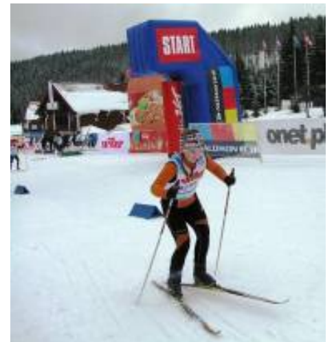
(2010.02.27 MULKS na Biegu na Igrzyska w Jakuszycach)

Zainteresowanych zapraszamy na stronę internetową LGD „Leśny Krąg” w Janowie Lubelskim: www.lesnykrag.pl - zakładka „Narciarstwo biegowe i śladowe”