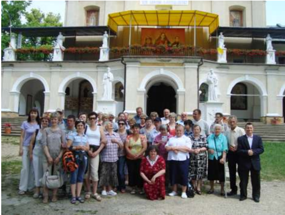
Mieszkańcy i Pracownicy „Barki” przed Sanktuarium w Kalwarii Pałacowskiej - 17.06.2011 r.

...Przed kilkunastu laty podróży owalem po ciemnym. W przedziale kolejowym jechałem ze mną młode małżeństwo ze swoim kilkuletnim synkiem. Ona położyła swoje małe główki na ramieniu i tak jechali przytuleni do siebie. Mały chłopiec przez chwilę przyglądał się swoim rodzicom i powiedział: „Ja też tak chcę”. Wtedy ojciec wziął go na kolana i siedzieli tak przytuleni do siebie wszyscy razem, rozmawiali po cichutku i serdecznie między sobą. Przyglądałem się im i