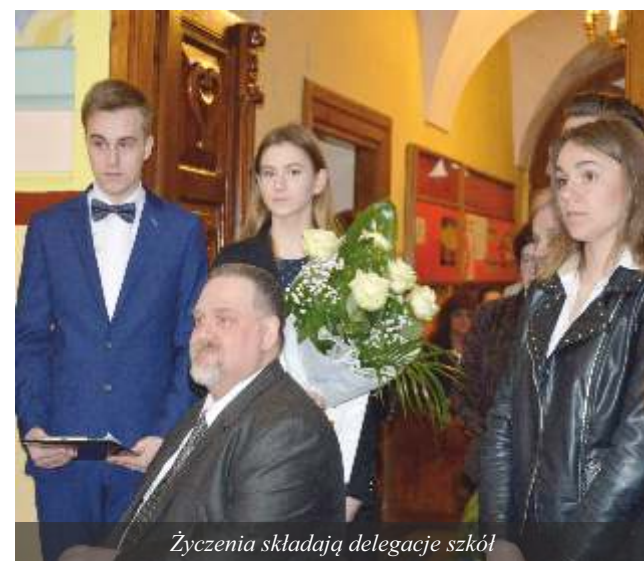
Życzenia składają delegacje szkół