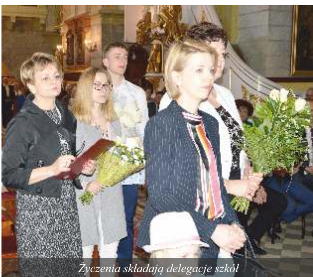
Życzenia składają delegacje szkół