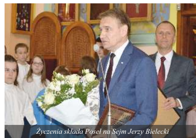
Życzenia składa Poseł na Sejm Jerzy Bielecki