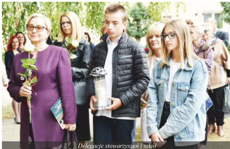
Delegacje stowarzyszeń i szkół