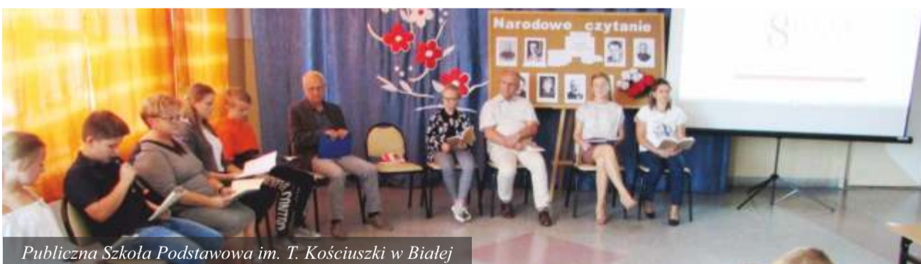
Publiczna Szkoła Podstawowa im. T. Kościuszki w Białej