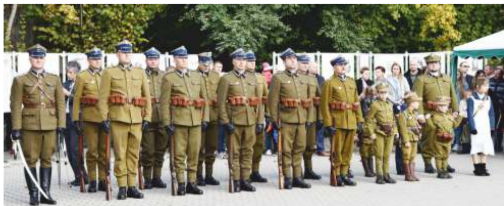
Uroczystości w Dzwoli