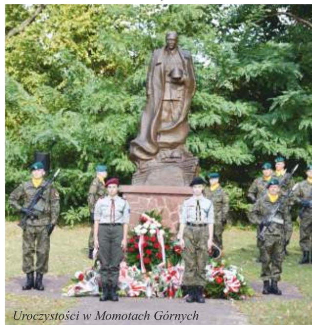
Uroczystości w Momotach Górnych