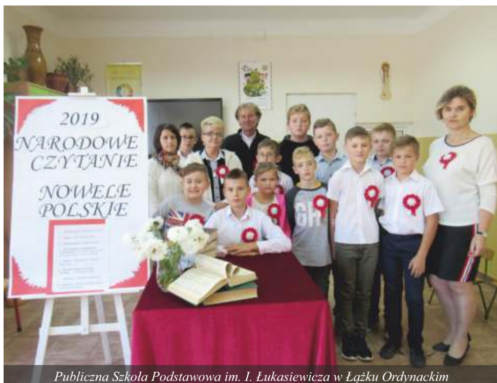
Publiczna Szkoła Podstawowa im. I. Łukasiewicza w Łązku Ordynackim