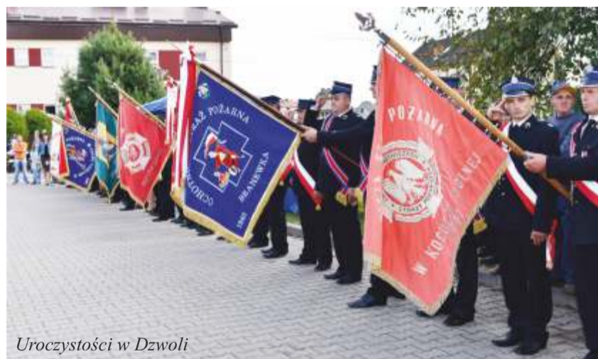
Uroczystości w Dzwoli