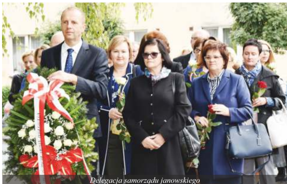
Delegacja samorządu janowskiego