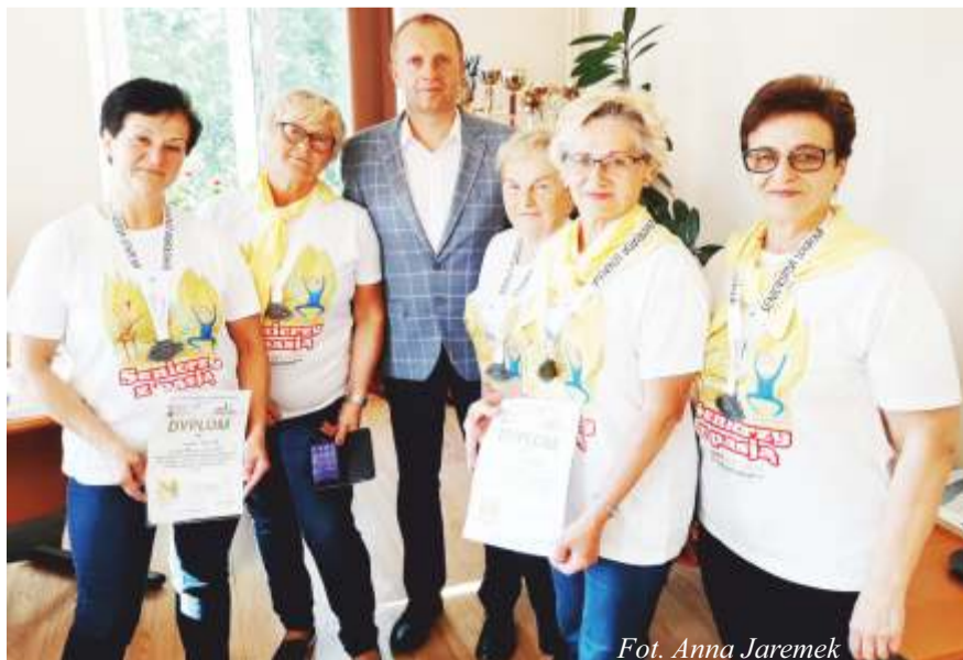
Fot. Anna Jaremek