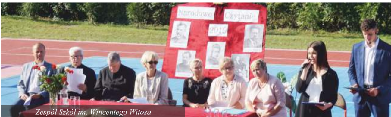
Zespół Szkół im. Wincentego Witosa