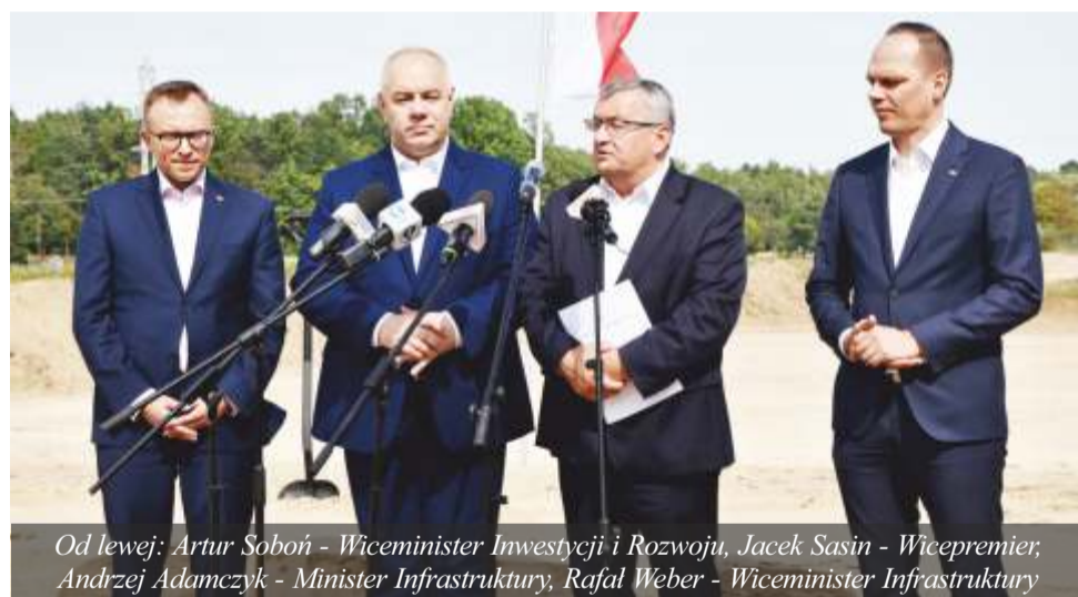
Od lewej: Artur Soboń - Wiceminister Inwestycji i Rozwoju, Jacek Sasin - Wicepremier, Andrzej Adamczyk - Minister Infrastruktury, Rafał Weber - Wiceminister Infrastruktury