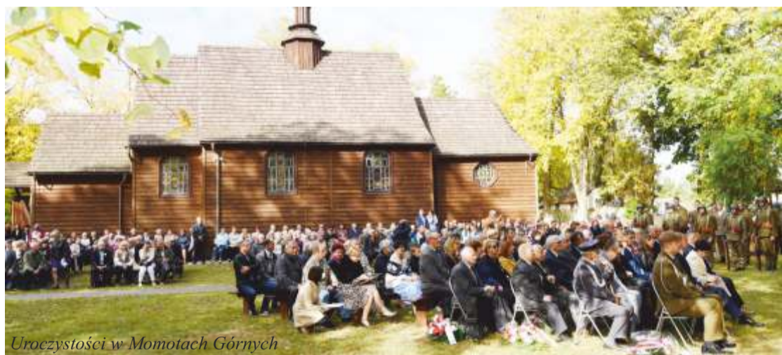
Uroczystości w Momotach Górnych