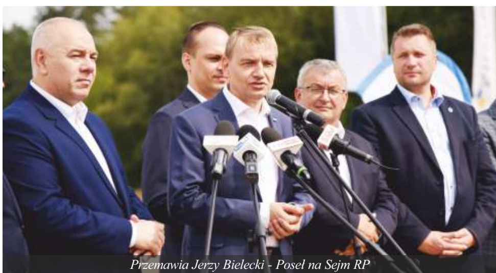
Przemawia Jerzy Bielecki - Poseł na Sejm RP