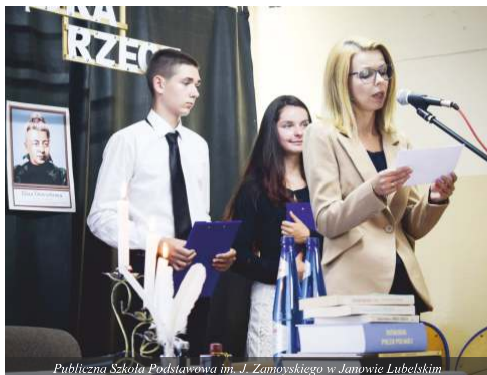
Publiczna Szkoła Podstawowa im. J. Zamoyskiego w Janowie Lubelskim