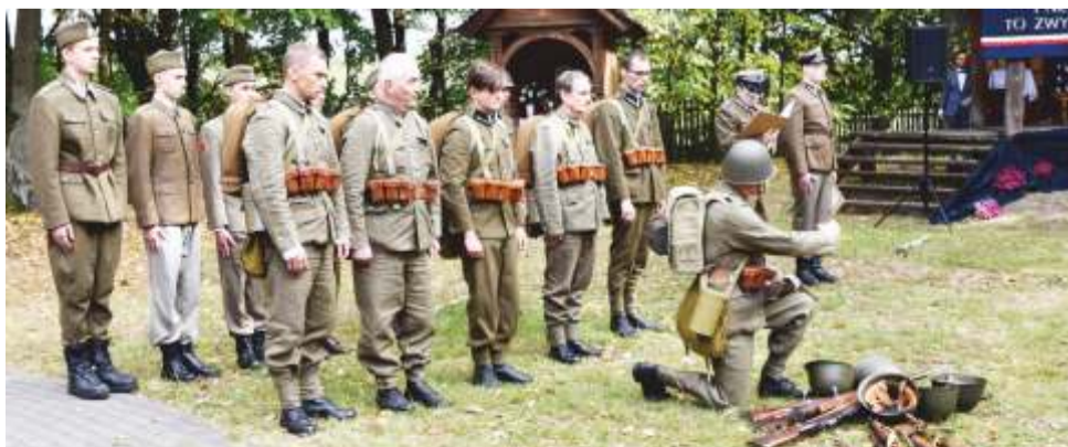
Uroczystości w Momotach Górnych