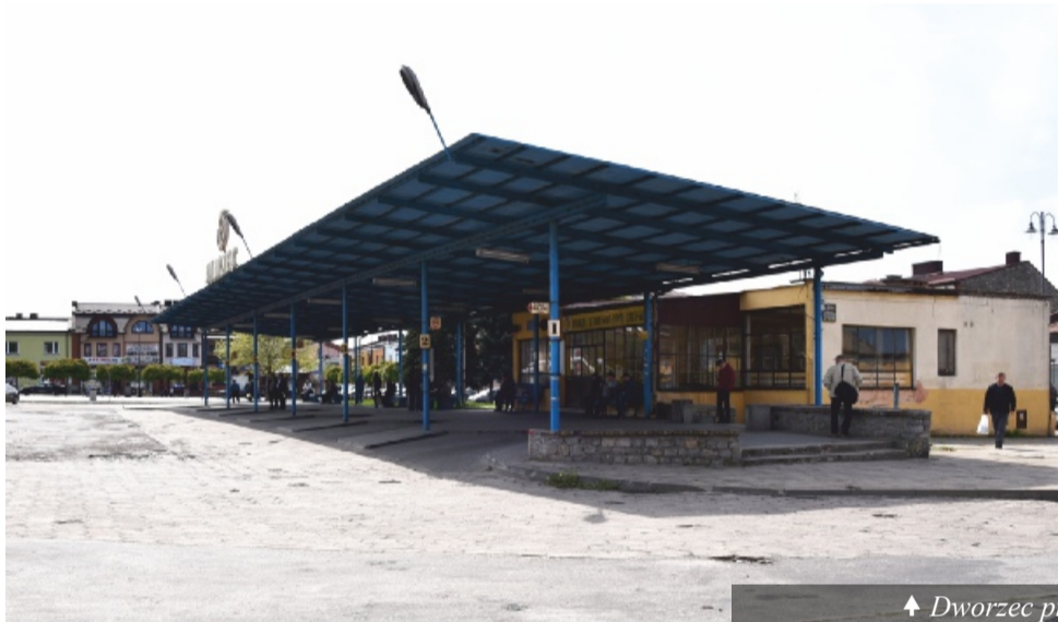
↑ Dworzec przed remontem ↑