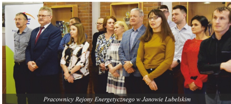
Pracownicy Rejonu Energetycznego w Janowie Lubelskim