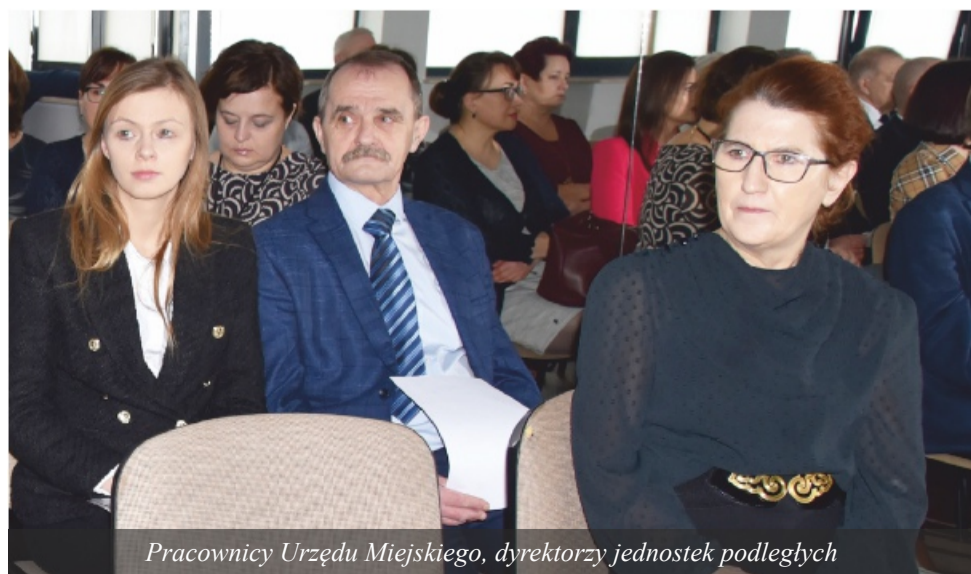
Pracownicy Urzędu Miejskiego, dyrektorzy jednostek podległych