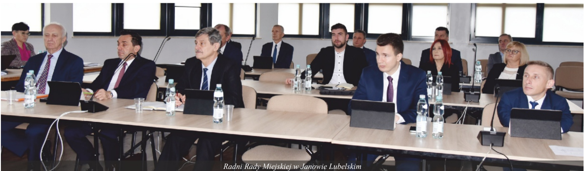
Radni Rady Miejskiej w Janowie Lubelskim