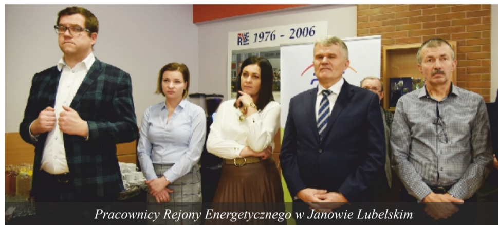
Pracownicy Rejonu Energetycznego w Janowie Lubelskim