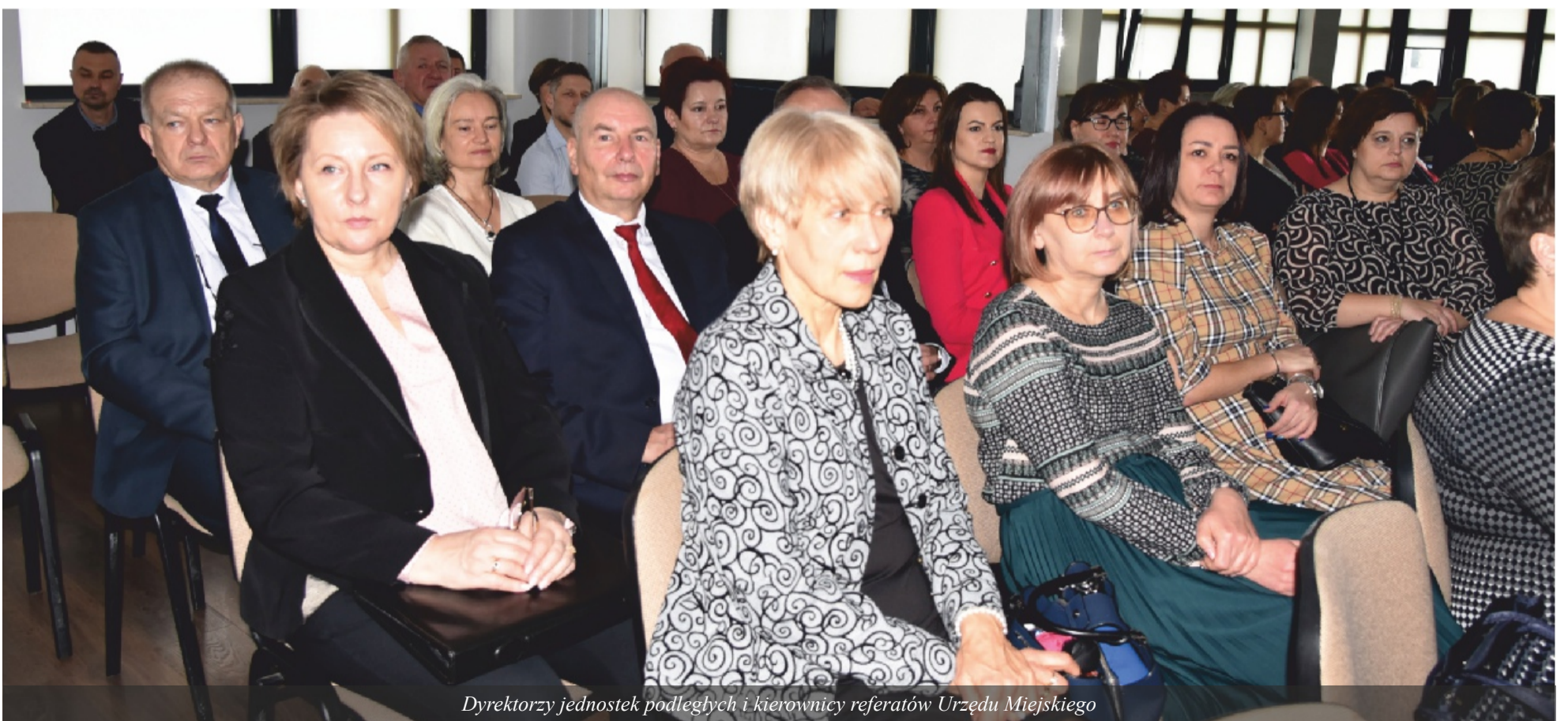
Dyrektorzy jednostek podległych i kierownicy referatów Urzędu Miejskiego