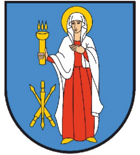
Herb Janowa Lubelskiego przed zmianą i po zmianie