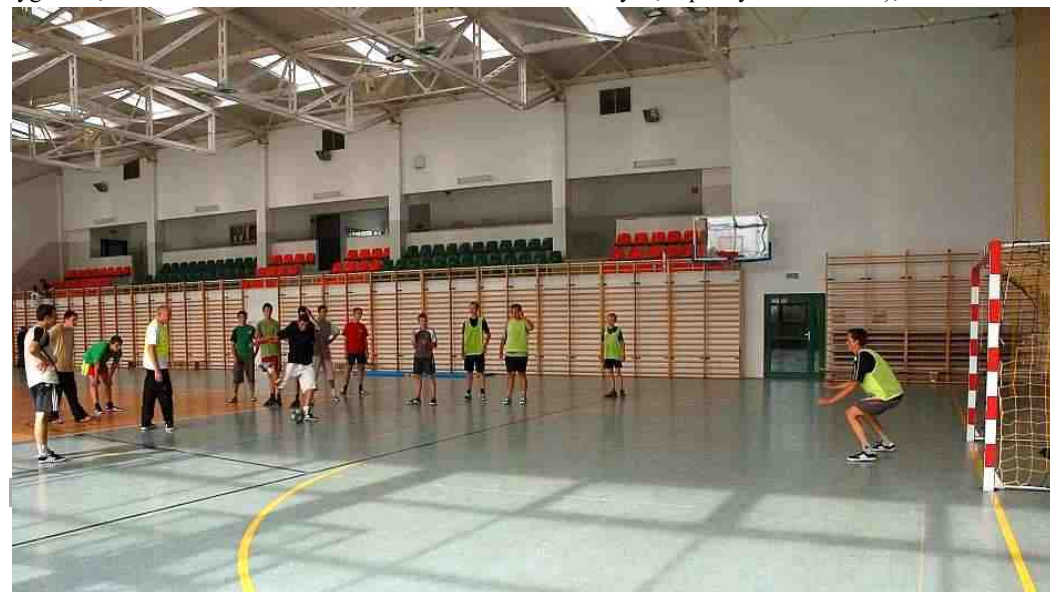
Hala sportowa w Zespole Szkół Rolniczych w Potoczku

TECHNIKUM ROLNICZE UZUPEŁNIAJĄCE DLA DOROSŁYCH nauka odbywa się 3 dni w tygodniu;