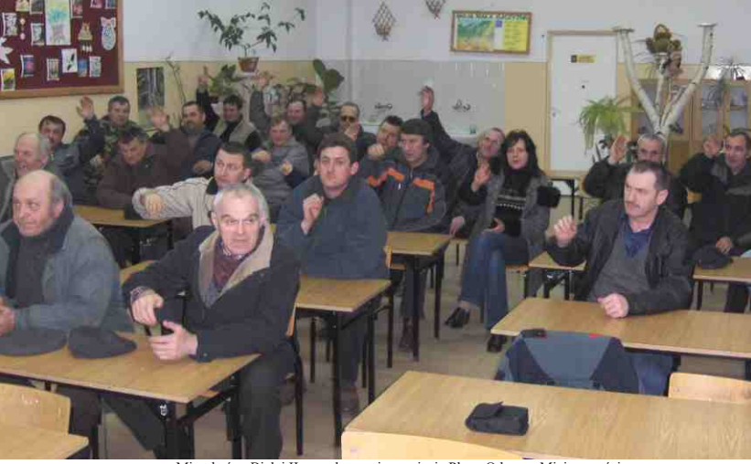
Mieszkańcy Białej II przegłosowali przyjęcie Planu Odnowy Miejscowości