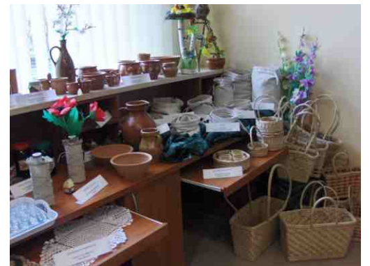
Centrum Certyfikacji Produktu Lokalnego w Modliborzycach