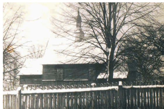
Widok kościoła w Momotach, początek lat 80 - tych

prezbiterium zostało podwyższone o więcej niż 50 cm. Pińciurek nie miał już nadziei na przyszłość, wiedział, że zostanie ukarany. Mimo to nadal dążył do udoskonalania rozpoczętego dzieła.