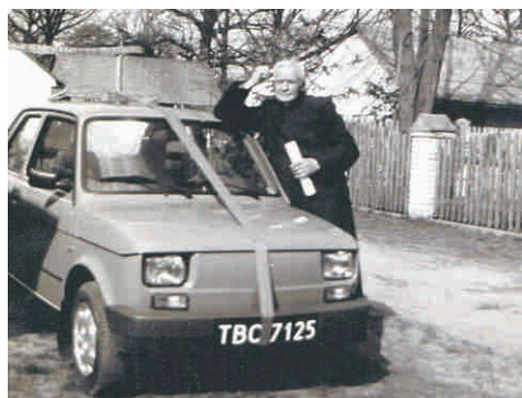
Proboszcz z prezentem od parafian. Wyjaśnienie tebligę rejestracyjną TBC - Tak Bóg Chciał. 71 - rok przybycia proboszcza do Momot, 25 - lata posługi w parafii Momoty

trudnych warunkach. Pozbawiony opieki matki, obeznany z głodem, klótlivością i pijanstwem ojca, musiał stać się samowystarczalny. Uważał, że jedynie wykształcenie może poprawić jego sytuację, dlatego był pilnym uczniem. W 1942 roku ukończył szkołę powszechną, by móc kształcić się w dwuletniej Szkole Handlowej w Biłgoraju. Wiedział, że jedynie zdobycie zawodu i pracy może pomóc mu w usamodzielnieniu się. Musiał jednak przerwać naukę w tej szkole, gdyż został zakwalifikowany do wyjazdu na przymusowe roboty do Niemiec. Nie dotarł jednak tam - zdołał