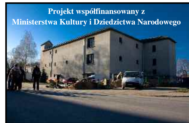
Projekt współfinansowany z Ministerstwa Kultury i Dziedzictwa Narodowego

Ministerstwa Kultury i Dziedzictwa Narodowego. Jeszcze tylko Muzeum, firma robi „podkopy” (jak to pod ziemię), doprowadzana jest sieć ciepłownicza, która biegnie za blokami przy ulicy 8 Września. Jeden z bloków ma piec w głowie, więc możliwość podłączenia się do tej sieci jest jak najbardziej realna. Lekko zmieni i podwracaniem wielkość inwestycji na terenie gminy ko czymś to niecodziennym eskapad. To, że Janów wielkim placem budowy, co do tego nie ma wątpliwości, ale będzie jeszcze więcej. Są jeszcze inwestycje, na które już podpisane umowy z odpowiednimi firmami. Modernizacja dwóch remiz strażackich w Białej II i Zofiannie Górnej, uzbrojenie terenów inwestycyjnych w Borownicy i kolejne ulice (w fazie przygotowywania pozwolenia na budowę) realizowane w tej samej technologii jak dotychczas, a mianowicie: ul. Kochanowskiego, 8 Września, Wiejska, Partyzantów, Wyszyńskiego i Kopernika.