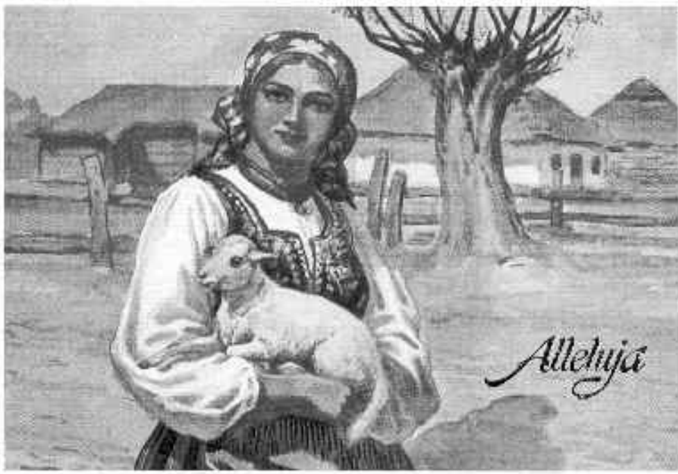
Pocztówka Wielkanocna - lata 30 -te XX wieku.