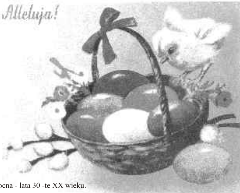
Pocztówka Wielkanocna - lata 30 -te XX wieku.

Z okazji zbliżających się Świąt Wielkiej Nocy składamy Państwu życzenia wszelkiej pomyślności, pogody ducha, dużo zdrowia i radości.