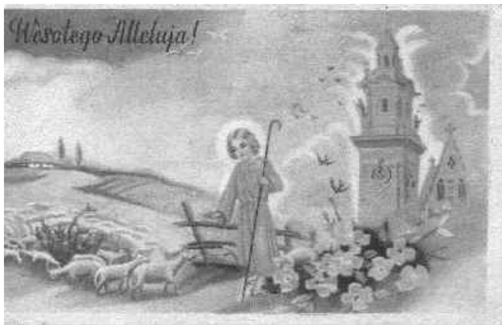
Pocztówka Wielkanocna - lata 30 -te XX wieku.