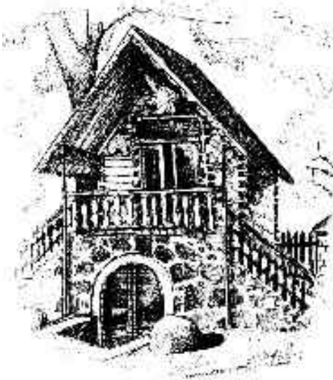
rys. Krzysztof Biżek