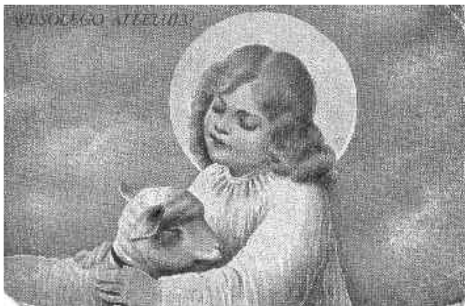
Pocztówka Wielkanocna - lata 30 -te XX wieku.