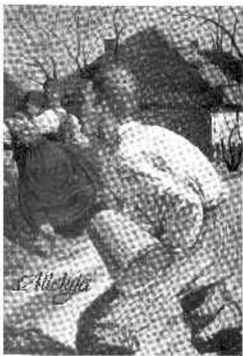
Pocztówka Wielkanocna - lata 30 -te XX wieku.