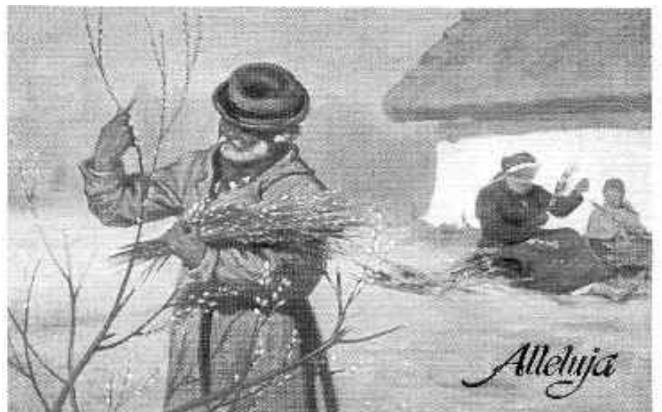
Pocztówka Wielkanocna - lata 30 -te XX wieku.