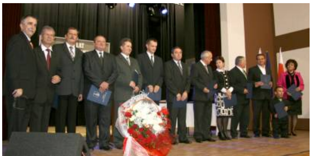
Rada Miejska V kadencji