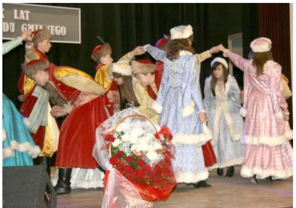
Występ artystyczny uczniów Publicznego Gimnazjum w Janowie Lubelskim