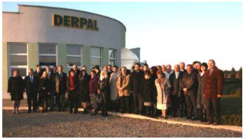
Z wizytą w Strefie Inwestycyjnej "Borownica"