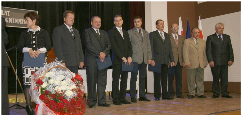
Rada Miejska IV kadencji