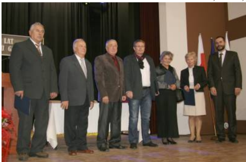
Rada Miejska II kadencji

Obrady 50 - tej sesji Rady Miejskiej zakończyły się występem artystycznym uczniów Publicznego Gimnazjum w Janowie Lubelskim. Po zakończeniu sesji, zainteresowani mogli obejrzeć wystawę okolicznościową.