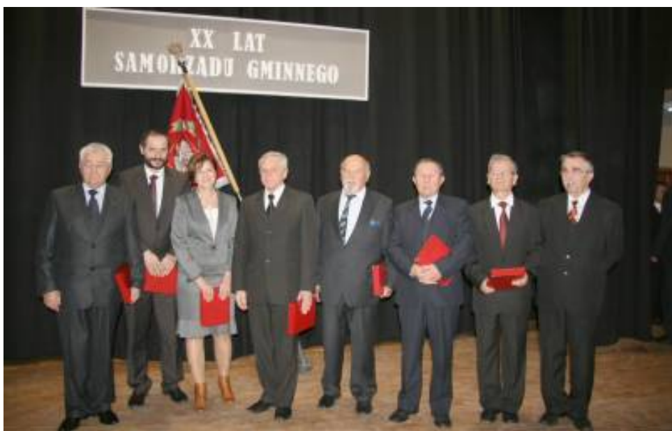
Wręczenie pamiątkowych grawertonów