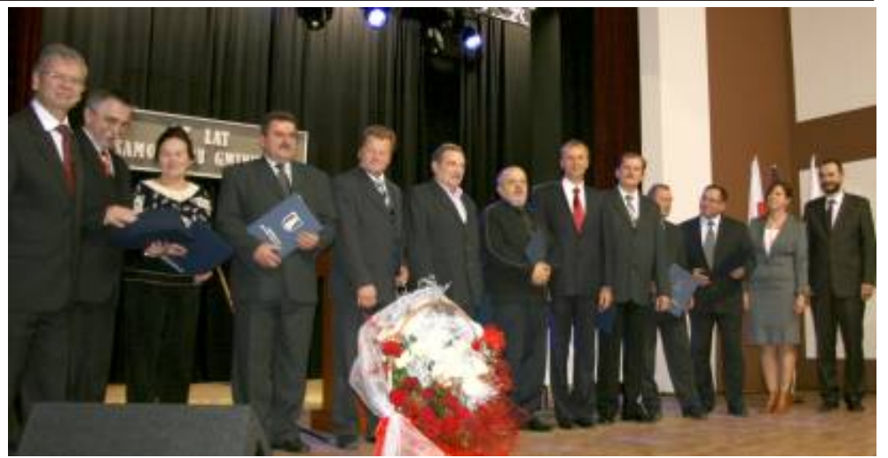
Rada Miejska III kadencji