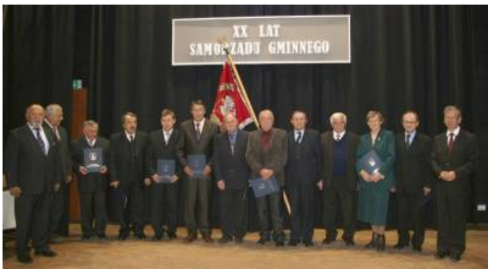
Rada Miejska I kadencji