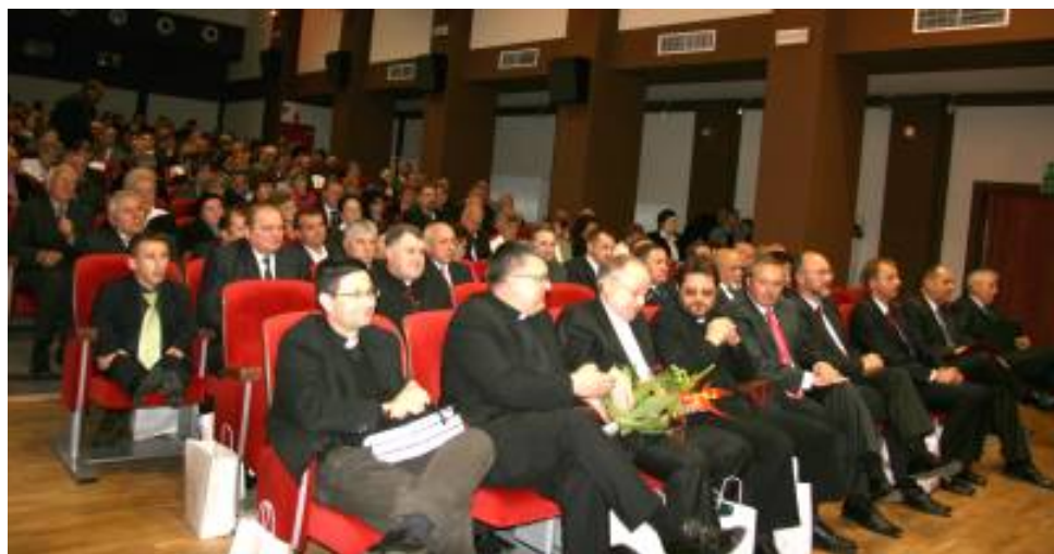
Zaproszeni goście w nowo otwartym Janowskim Ośrodku Kultury

Uroczystości rozpoczęły się od mszy świętej w Sanktuarium Matki Bożej Łaskawej Różańcowej, w której wzięli udział przedstawiciele władz samorządowych ubiegłych i obecnej kadencji oraz pracownicy Urzędu Miejskiego. Następnie uczestnicy mszy przeszli ulicami Janowa w asyście Olek Orkiestra do zmodernizowanego i rozbudowanego Janowskiego Ośrodka Kultury, będącego jedną z najnowszych inwestycji w naszym mieście. Przed wejściem głównym nastąpiło symboliczne przecięcie wstęgi oraz poświęcenie budynku, a tym samym oficjalne otwarcie nowoczesnego obiektu.