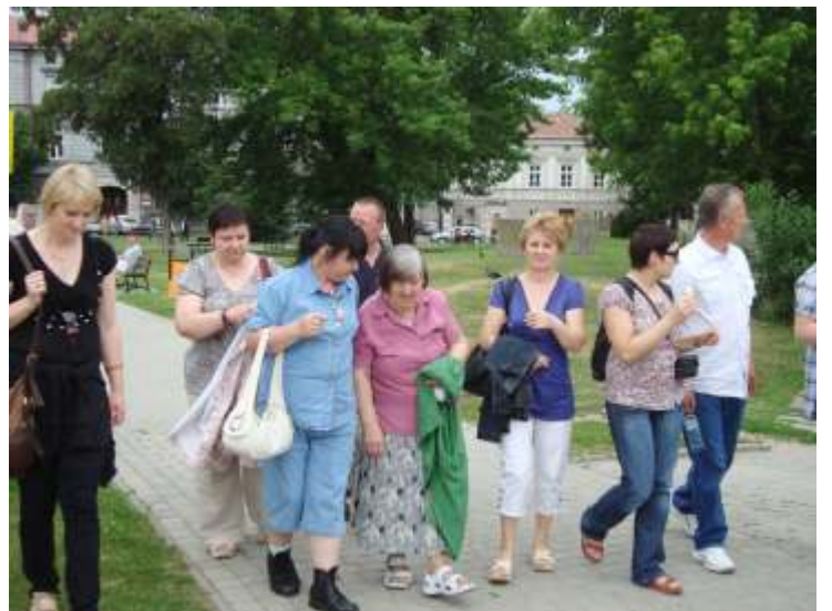
Pracownicy i Mieszkańcy w Przemysłu

Katecheci i katechetki nieustannie poszukują najodpowiedniejszego porównania, aby na lekcjach religii jak najlepiej zobrazować niewyobrażalnego tajemniczego troistej jedno. Mówi o drzewie, które choć ma korzenie, pień i koronę, to jednak pozostaje czymś jednym. Pokazują dzieciom rysunek, na którym płomienie trzech wieców zsiadają w jeden płomień. Byłoby to porównanie jako przemawiające do dzieci, ale chyba jeszcze lepszy obraz Trójcy Przenajświętszej zobaczyłbyś na choście w parkach. Siedzą na ławkach zakochani ludzie o siwych włosach. Trzymają się za pomarszczone ręce. Prawdziwa miłość, choć na pewno nie bez konieczności