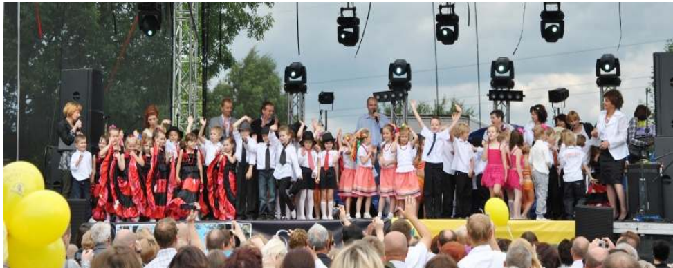
Wyst py dzieci z Przedszkola nr. 2