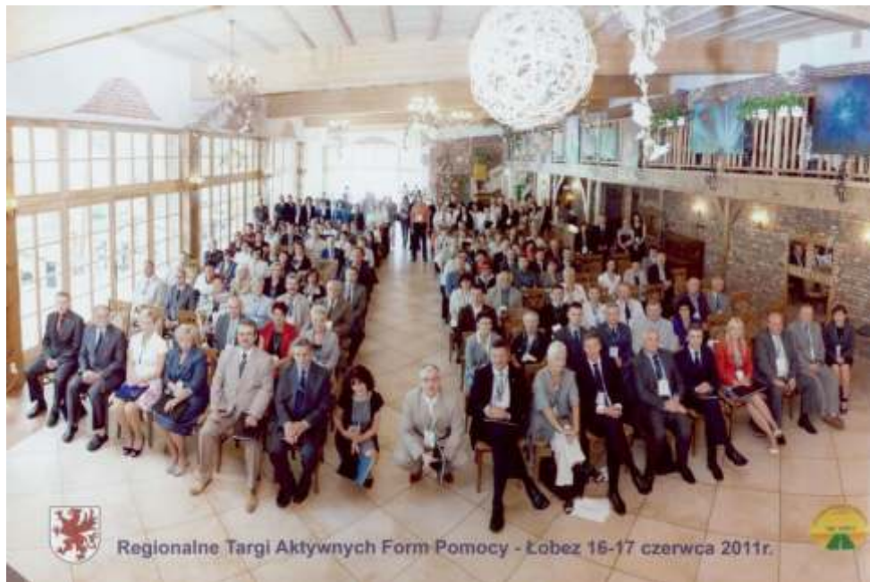
Regionalne Targi Aktywnych Form Pomocy - Łobez 16-17 czerwca 2011r.

samorz dów, organizacji pozarz dowych i ich partnerów. Spotkanie miało równie celu wzmocnienie przekonania o warto ci idei polityki społecznej i gospodarki społecznej – poprzez partnerskie działania sektorów: pozarz dowego, publicznego, sektora nauki i sektora prywatnego w tym obszarze. Uczestnicy mieli mo liwo zaprezentowania dobrych praktyk dzi ki