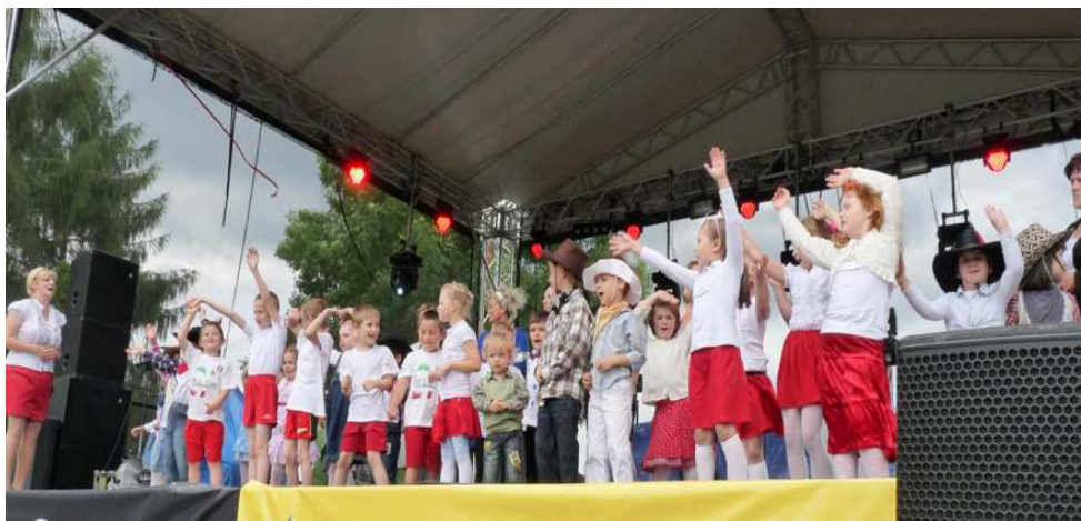
Wyst py dzieci z Przedszkola Niepublicznego