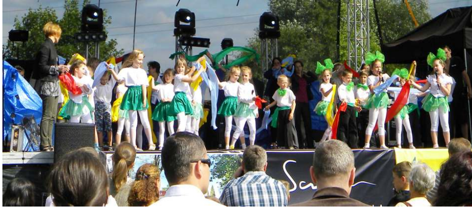
Wyst py dzieci z Przedszkola nr. 1