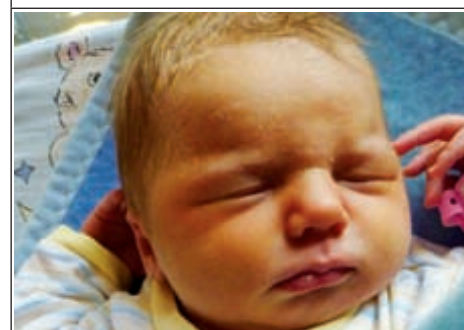
Córka Magdaleny z Rzeczy Ziemiańskiej