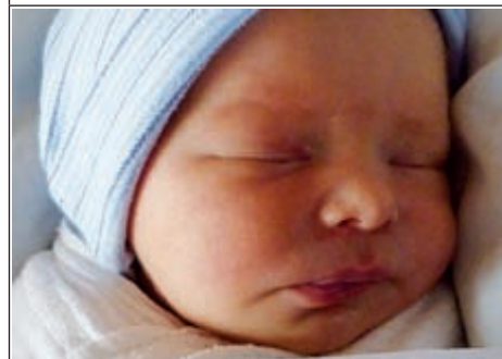
Córka Iwony z Nowych Moczydeł