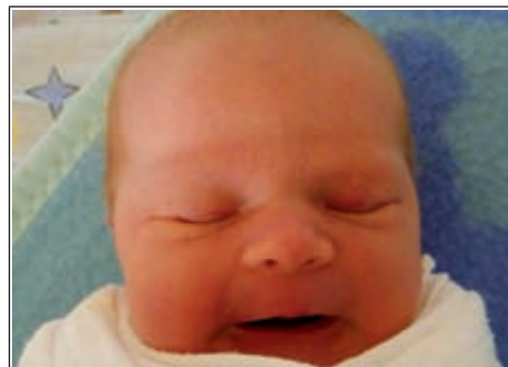
Córka Agaty z Owczarni