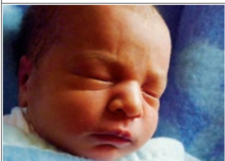
Syn Jadwigi z Zdziłowic