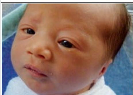
Syn Sylwi z Blinowa