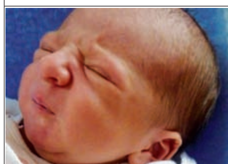
Syn Joanny z Wolicy