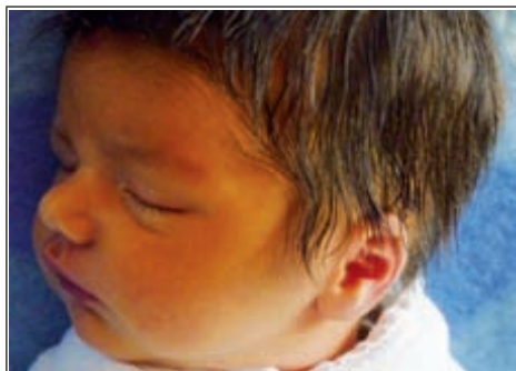
Córka Małgorzaty z Otracza