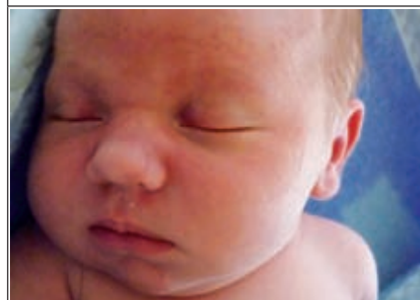
Syn Doroty z Bononii