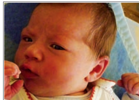
Córka Bernadety z Zdziłowic