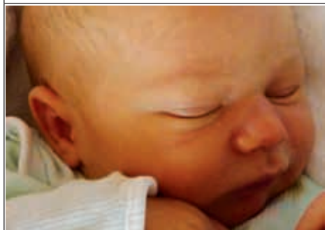
Syn Iwony z Huty Józefów