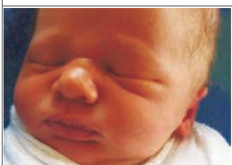
Syn Anny z Krzemienia