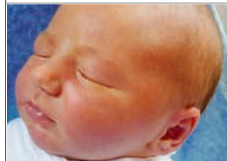
Syn Anny z Szastarki