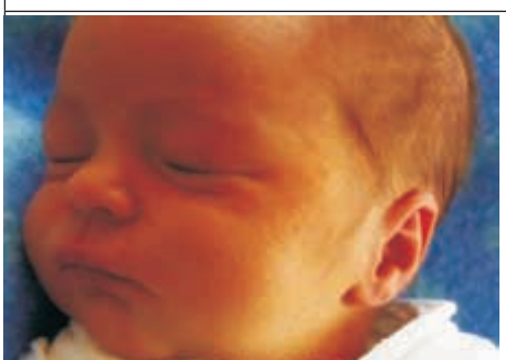
Córka Kingi z Zofianki Górnej