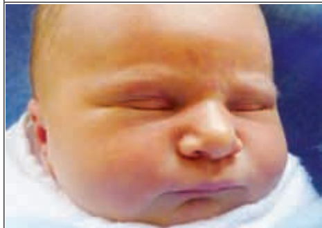
Córka Agnieszki z Modliborzyc