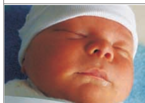
Syn Patrycji z Bilgoraja