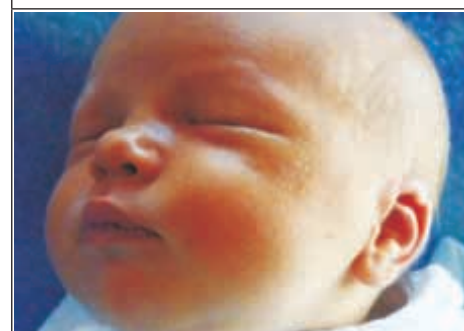
Córka Agnieszki z Łady