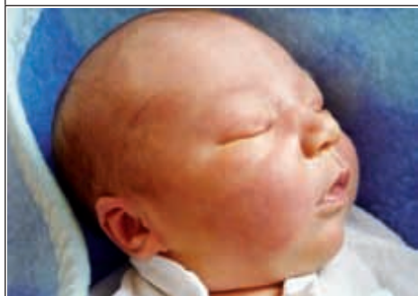
Syn Katarzyny z Wierzchowisk