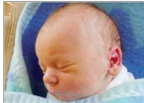
Syn Teresy z Błażka