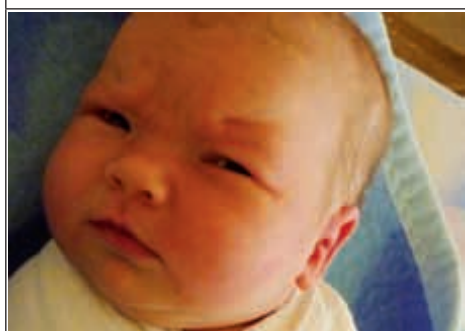
Córka Doroty z Białej