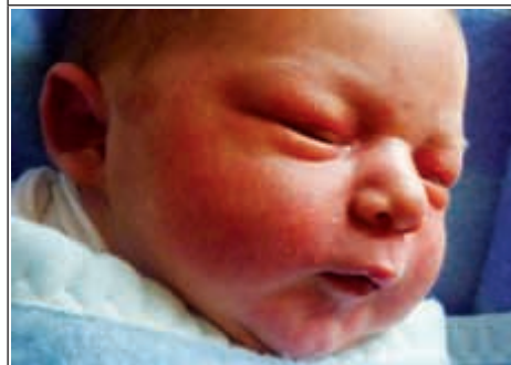
Syn Anny z Janowa Lubelskiego