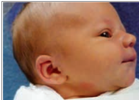
Syn Agaty z Janowa Lubelskiego

Od początku roku do 15 grudnia br. w Janowskim szpitalu przyszło na świat 297 dzieci.