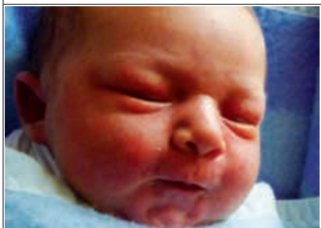
Syn Anny z Janowa Lubelskiego