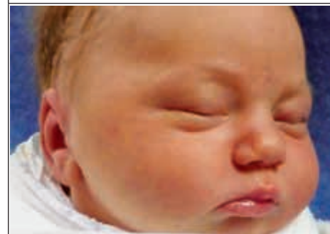
Córka Agaty z Władysławowa