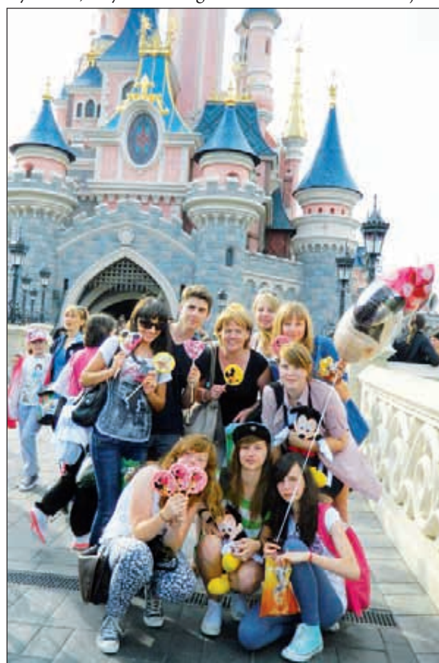
W klasie sportowej Publicznego Gimnazjum im. Jan Pawła

Szkoła zadbała również o umożliwienie uczniom poznania ciekawych miejsc w kraju i w Europie organizując liczne wycieczki, w tym dwie zagraniczne- do Włoch i Francji.